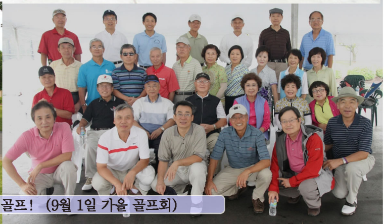
춘계 골프 (5월 26일), 비가 와도 골프! (9월 1일 가을 골프회)