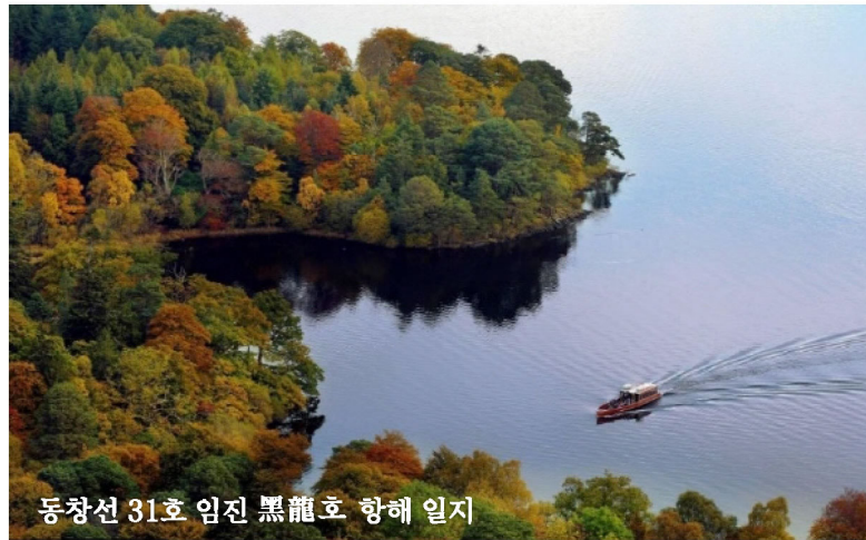
동창선 31호 임진 黑龍호 항해 일지

동창회의 기간사업인 장학생 선발은 10월 5일 장학생 심사위원회가 지원자중 7명을 장학생으로 선발한 것으로 알려지고 있다. 현재까지 동창회의 균형 재정의 유지를 돕고자 94명의 동문들이 동창회비를 내시고, 69명의 이사들께서 이사회비를 내셨다.