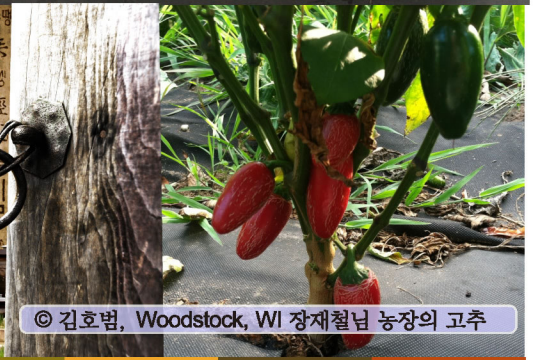
© 김호범, Woodstock, WI 장재철님 농장의 고추