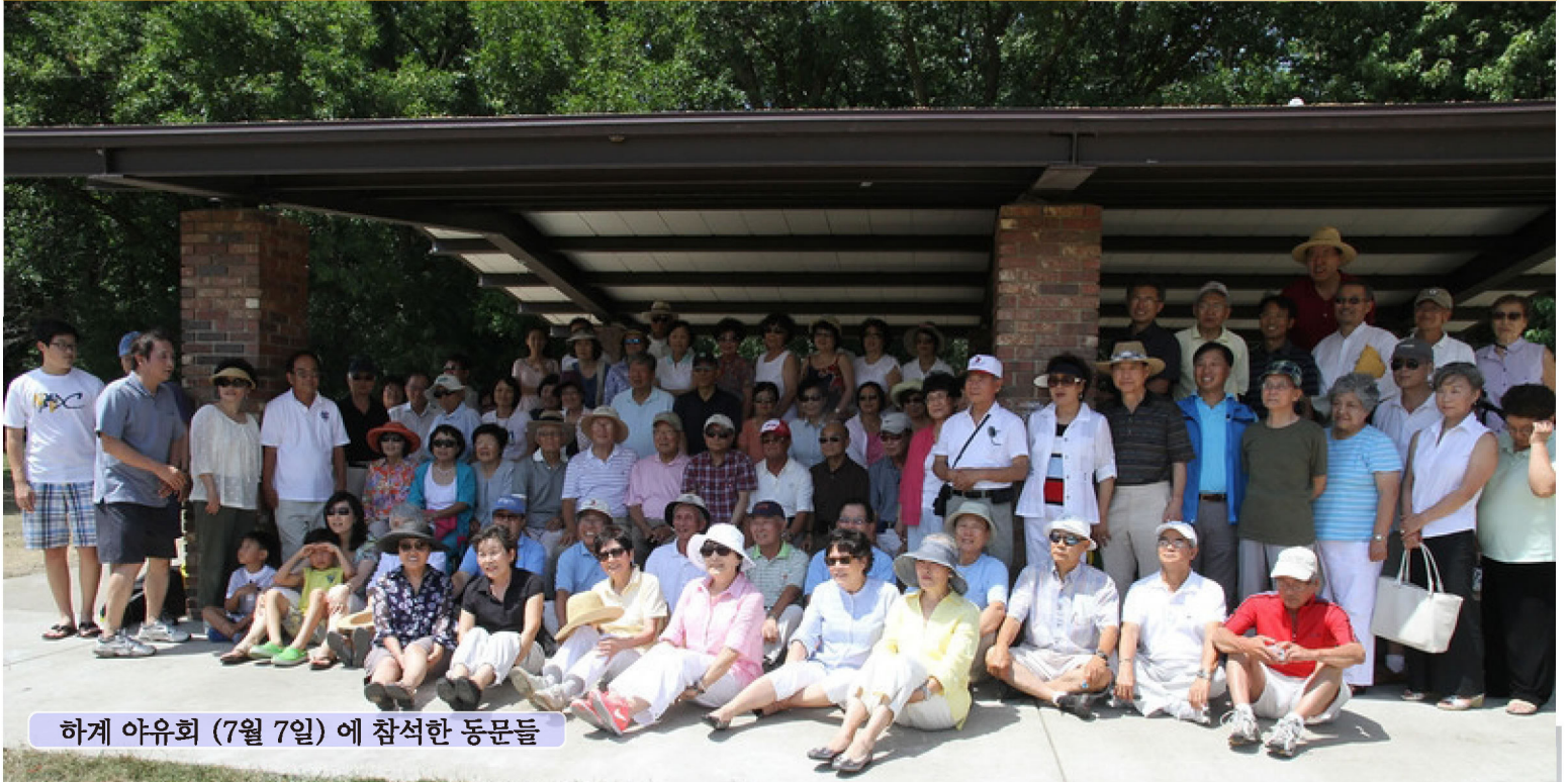
하계 야유회 (7월 7일) 에 참석한 동문들