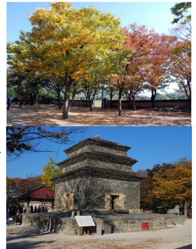
천년신라의 고찰 분황사 모전석탑(아래)와 석탑을 지키는 낙낙장승(위)

송년행사 : 송년회(11월 15일), 오케스트라 홀 나들이 (12월 2일) 등 예정 (소식지 8면 참조)