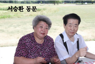
새로오신 동문들을 환영합니다